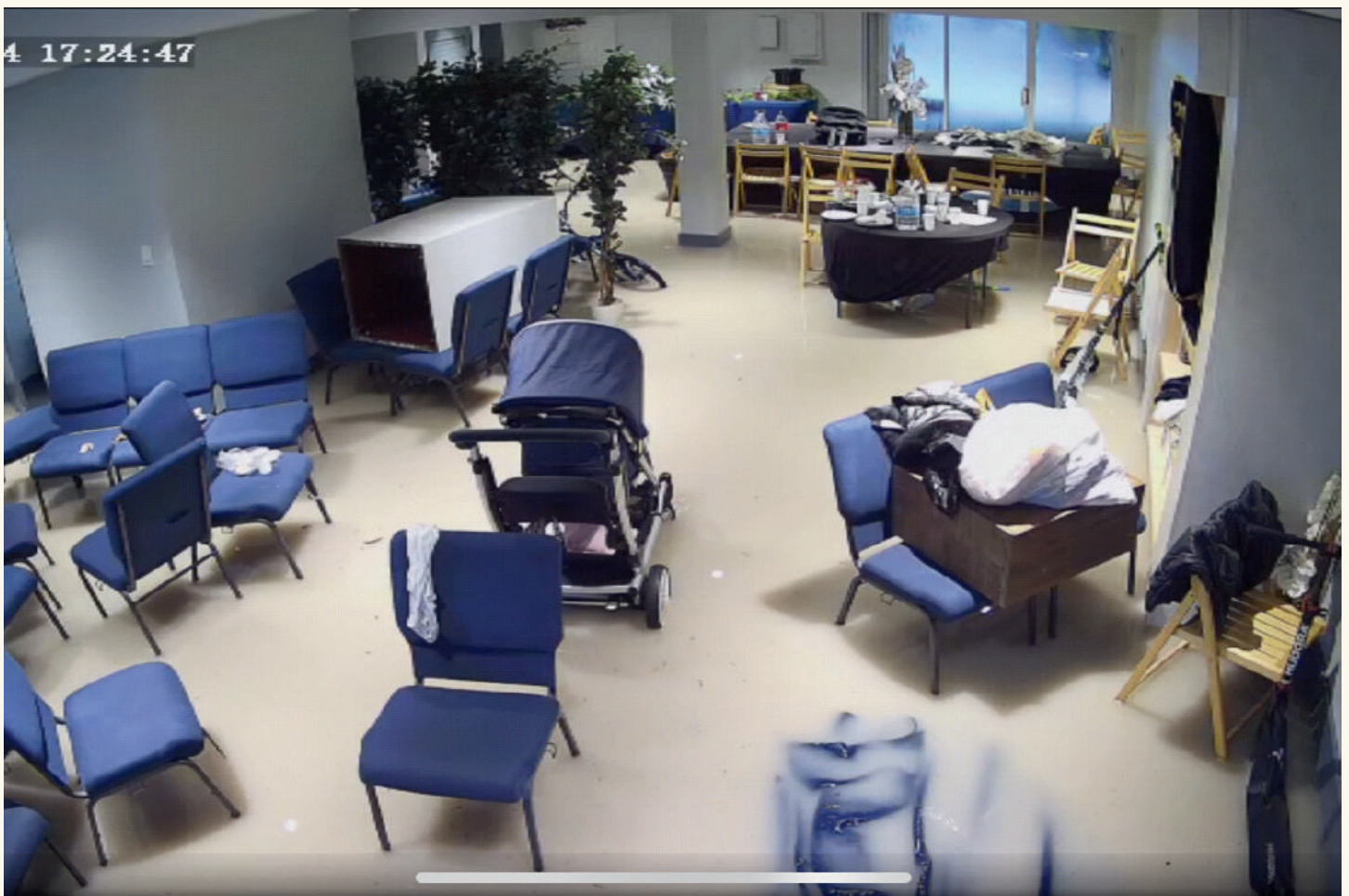
Todo interior do Centro alagado após as fortes chuvas que afetaram Miami no mês de Junho.

Estamos prontos para os próximos passos deste sonho, mais fortalecidos do que nunca. Junho nos lembrou de que, mesmo na adversidade, podemos encontrar força e motivação para seguir em frente.